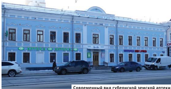
Современный вид губернской земской аптеки